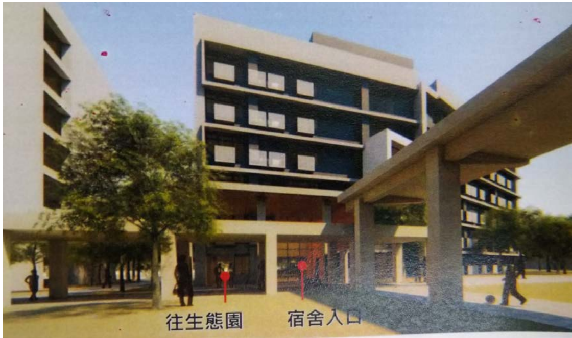
往生態園 宿舍入口