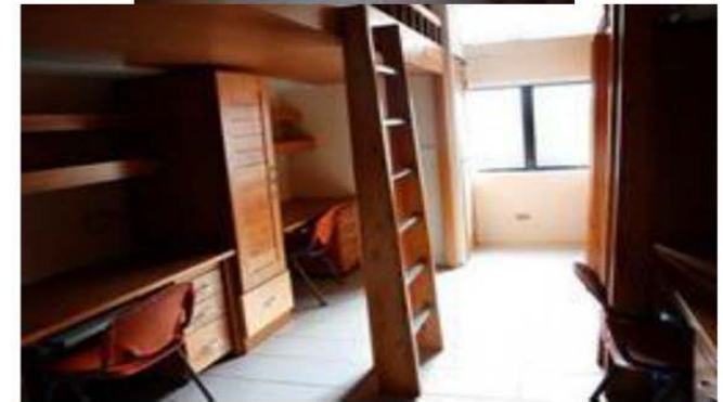
▲由外向內〈牆壁上裝有分離式冷氣〉